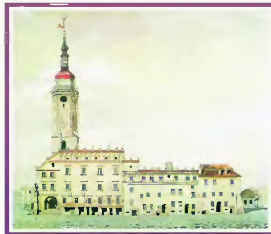
Lwów, Stary Ratusz od południa