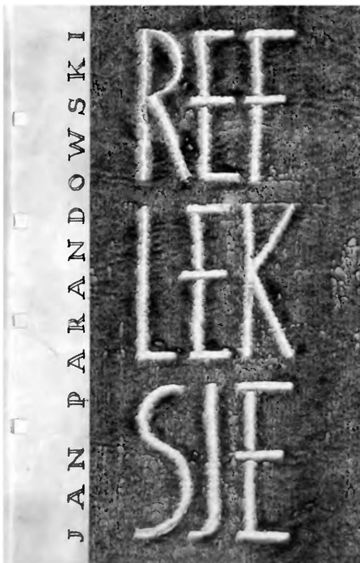
Okładka wykonana przez Stanisława Wilczka