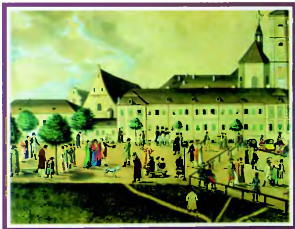
Lwów, Wały Hetmańskie