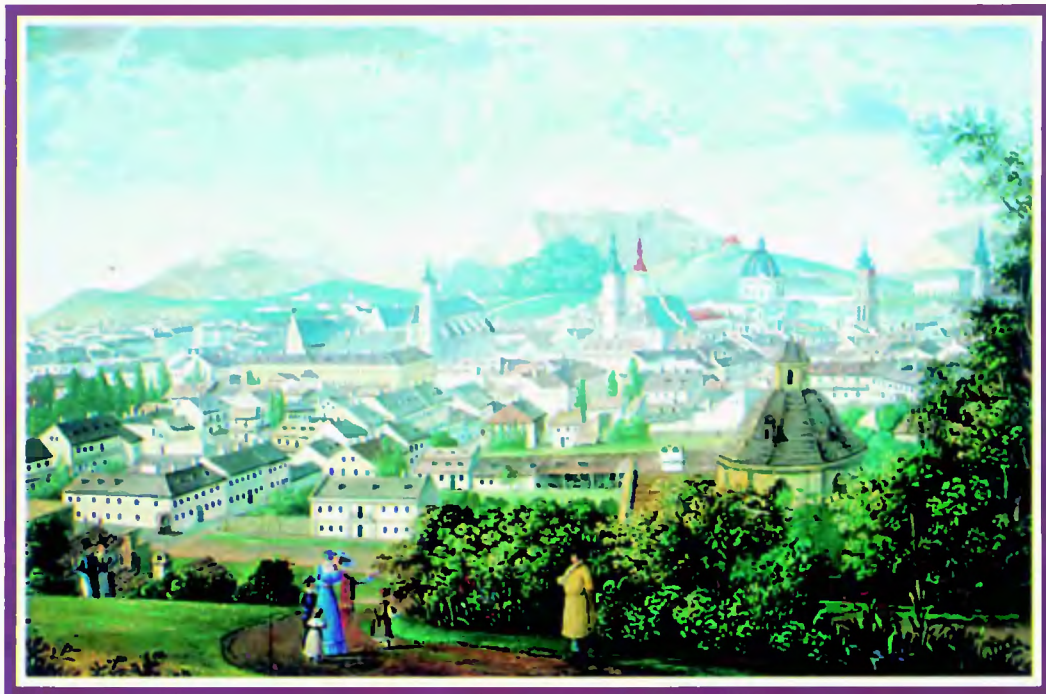
Widok ogólny Lwowa,