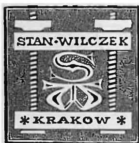
Ekslibris krakowskiego artysty introligatora Stanisława Wilczka