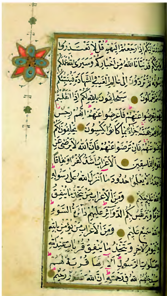
Ozdobne karty Koranu, XIX w.