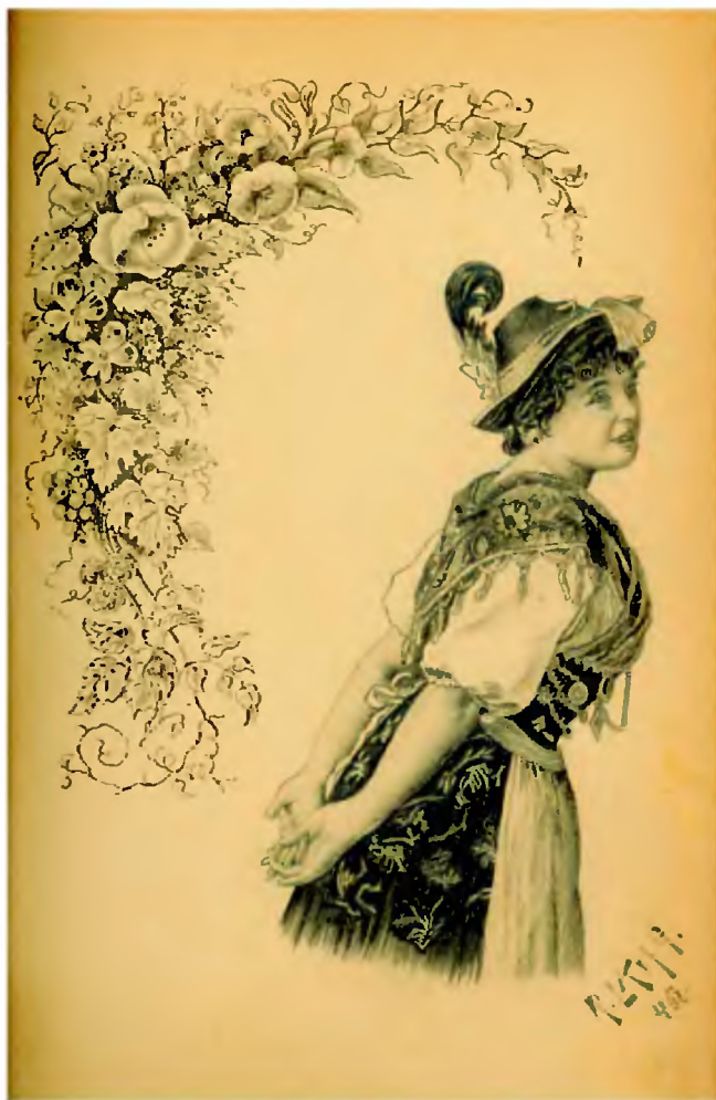
Księga aforyzmów, myśli, zdań... Lwów, 1888, karta przedtyt. z odręcznym rysunkiem R. Langa