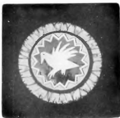
ORDER BIAŁEGO KRUKA