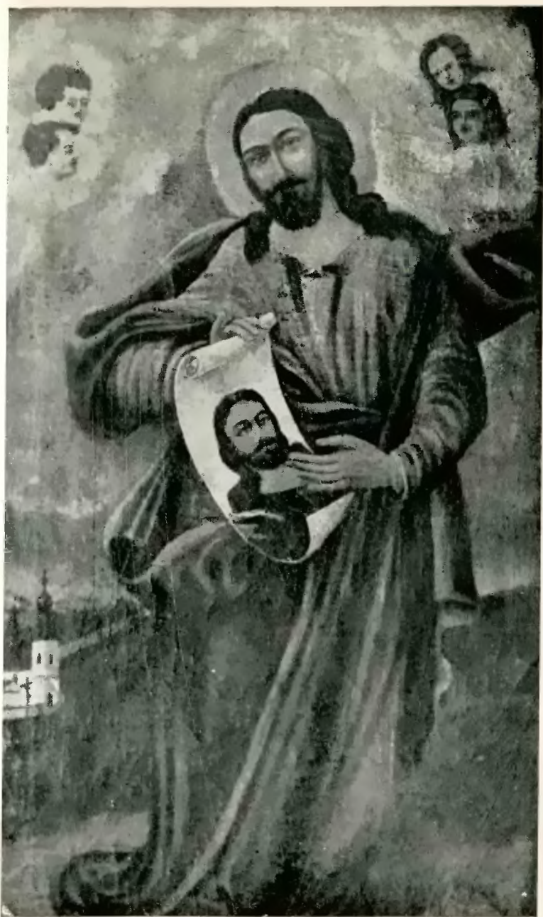
Angeblich alte Kreuzkirche in Miedhowitz (Original in der Korpus Christi-Kirche zu Miedhowitz)