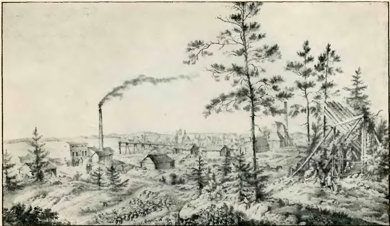
Miechów um 1850 (Nach der Knippel'schen Lithographie)