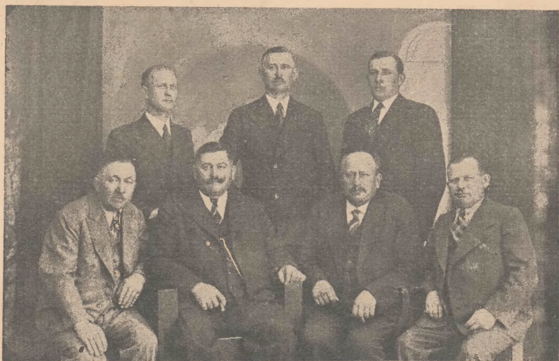
Obeeny Zarząd Cechu