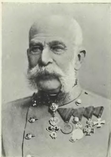
† KAISER FRANZ JOSEF I.