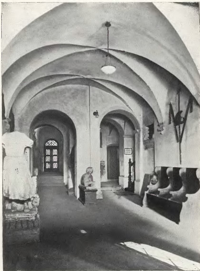
SIEŃ MUZEUM HISTORYCZNEGO M. LWOWA