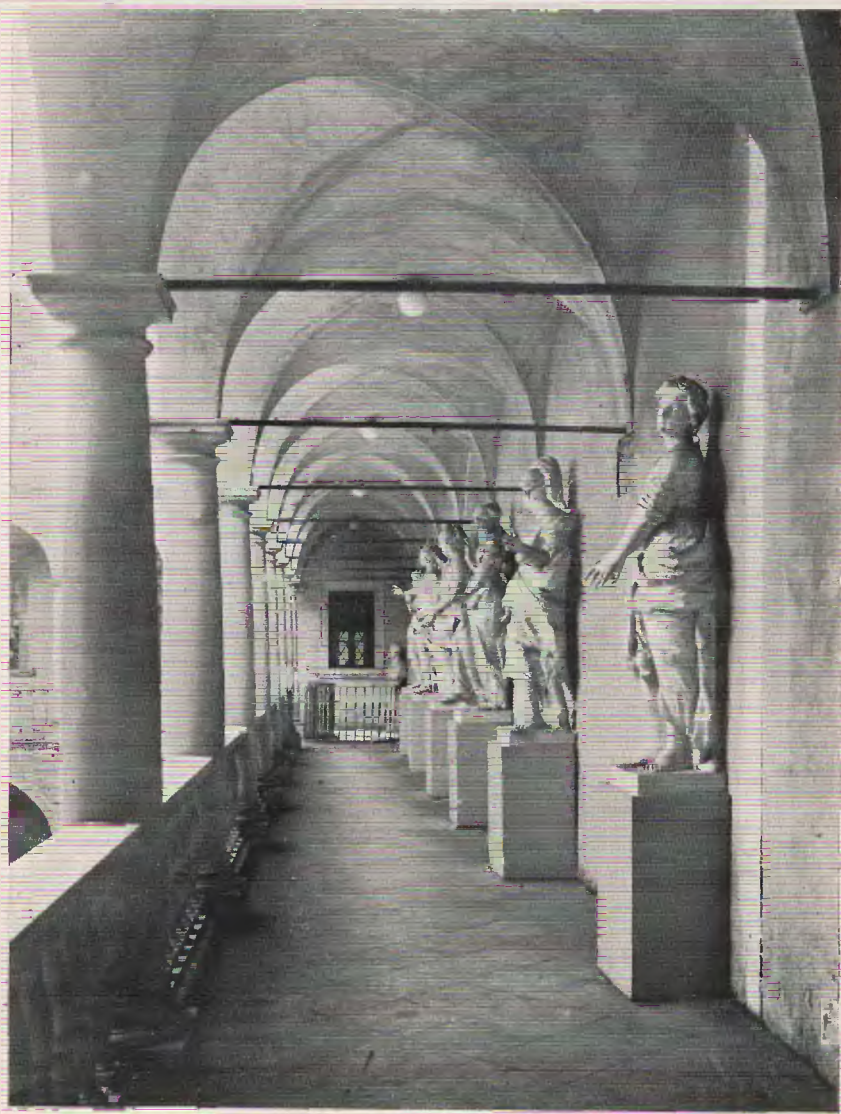
FRAGMENT KRUŻGANKÓW KAMIENICY KRÓLEWSKIEJ