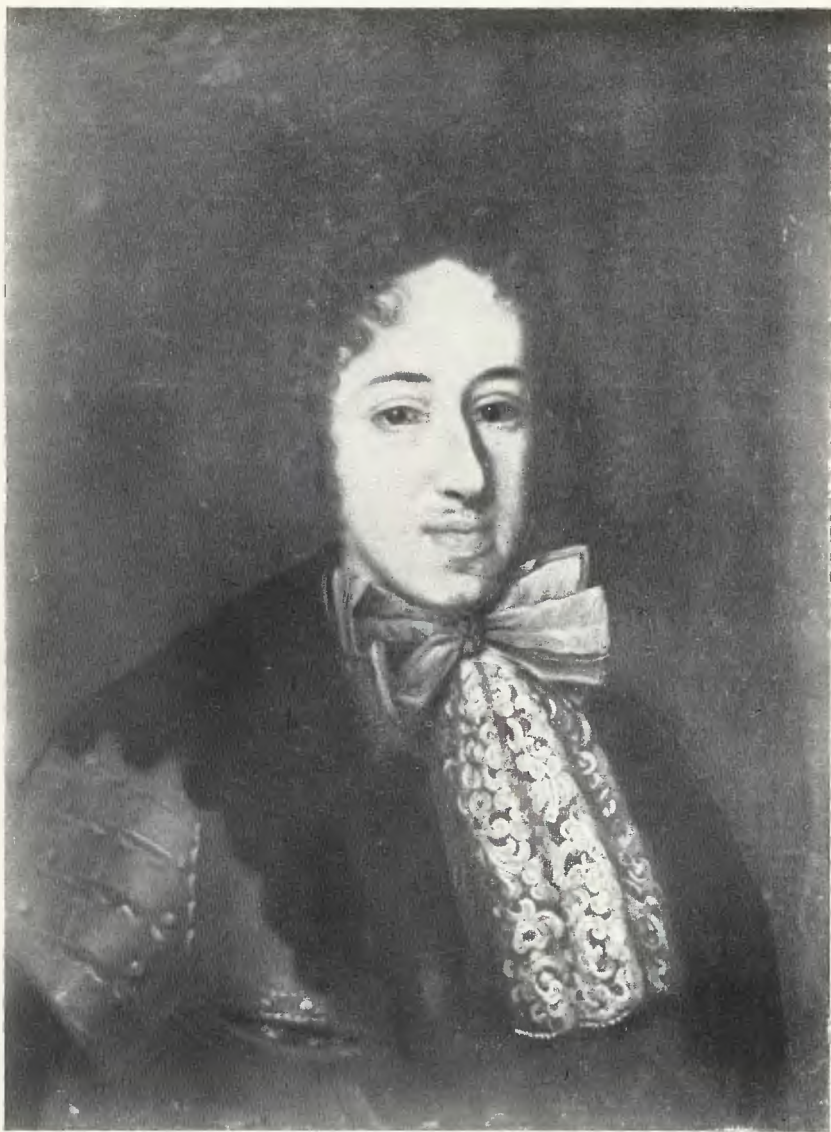
MAKSYMILJAN II EMANUEL, elektor bawarski, zięć króla Jana III

(Portret olejny, współczesny, nabyty w r. 1934)