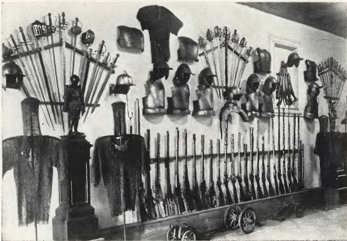
FRAGMENT „SALI BRONI“