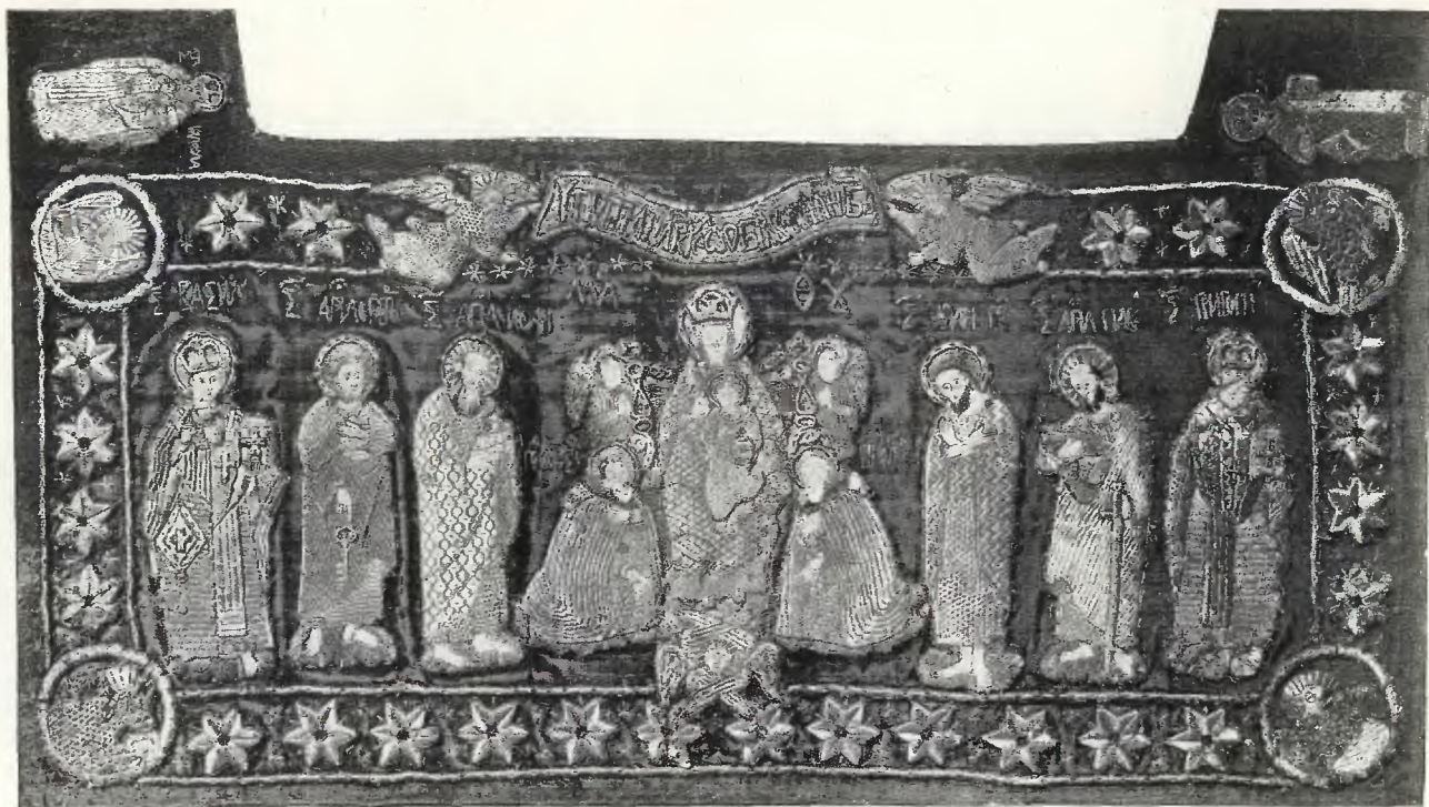
HAFT Z ORNATU RUSKIEGO (FELONU) w. XVI/XVII