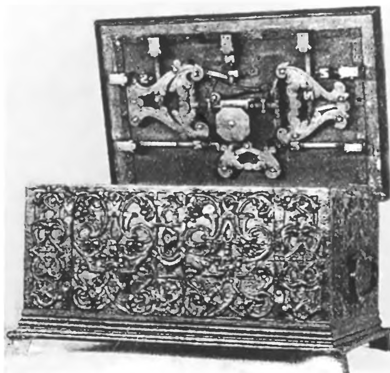
Żelazna skrzynia cechowa Cechu Szewców w Żorach. Wykonana w okresie międzywojennym.