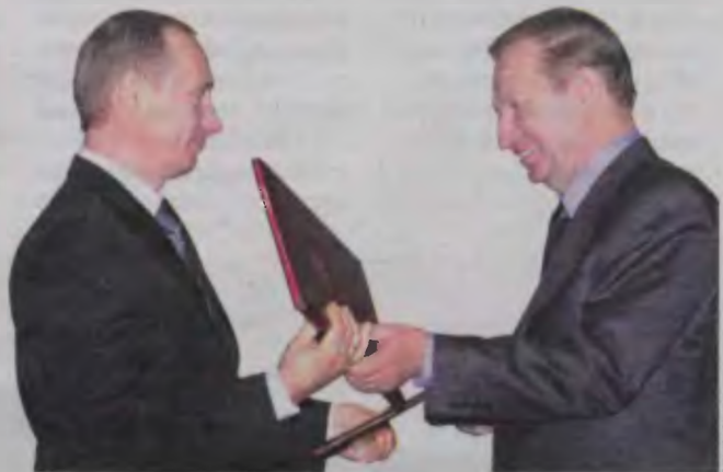
Prezydent Rosji Władimir Putin (z lewej) i prezydent Ukrainy Leonid Kuczma wymieniają dokumenty.