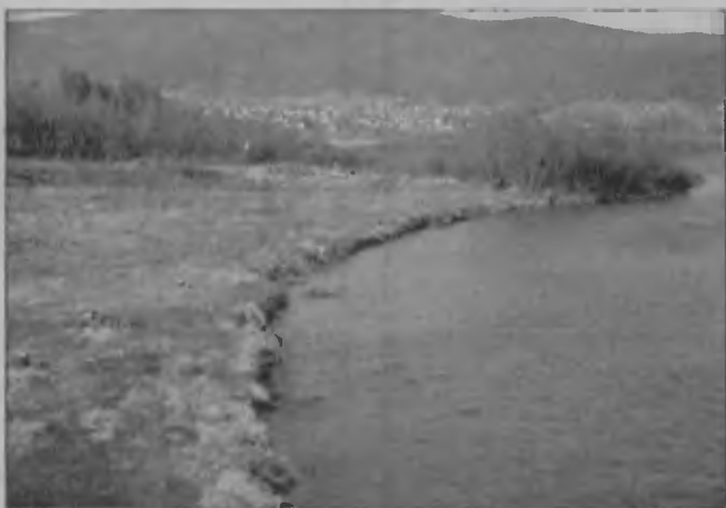
Po wybudowaniu systemu przeciwpowodziowego Jezioro Żywieckie nie będzie już tak zabrudzone. Mniej ryzykowne będzie też zagospodarowanie linii brzegowej zbiornika.

otrzyma sporo pieniędzy na budowę progów wodnych i małych zbiorników retencyjnych oraz monitoring.