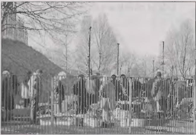
Bazar na stadionie żużlowym przyciąga wielu klientów.