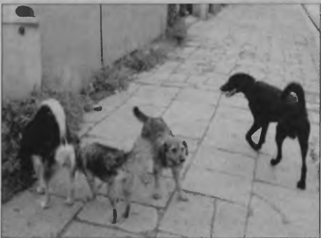
Każdy ples chciałby mieć troskliwego pana.

Otwarte dwa lata temu schronisko ma obecnie dwudziestu szczekających i jednego miauczącego lokatora. Cała ta menażeria pochodzi z Myszkowa i najbliższych okolic. Gminy sąsiednie nie kwapią się jednak do lożenia na bezpanski psy i koty. Na zakup czworonoga trzeba mieć odliczone 35 zł. Jest przy tym zaszczepiony i odrobaczony. W ubiegłym roku nowych właścicieli zdobyło ponad 180 zwierząt. ■ BOK