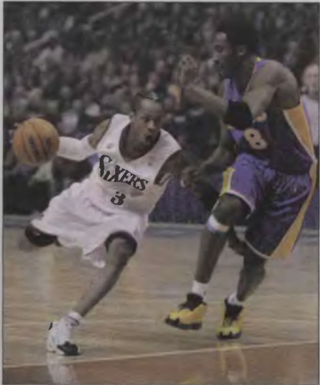
Allan Iverson (z lewej) i Kobe Bryant – Allan