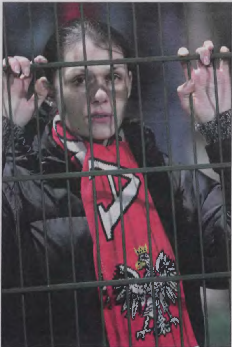
Ile są w stanie zapłacić polscy kibice, by na żywo oglądać biało-czerwonych?