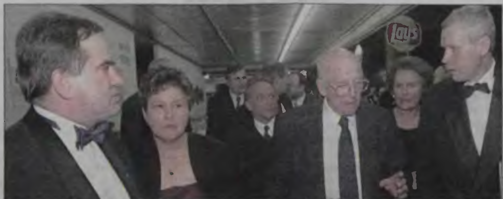
Jan Nowak Jeziorański podczas uroczystości wręczenia Laurów Umiejętności i Kompetencji.