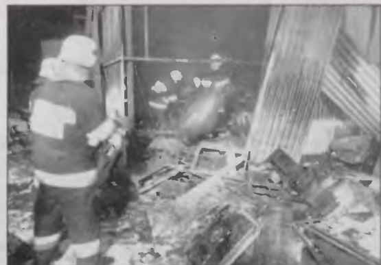
Spłonęła ponad połowa magazynu, w którym na drewnianych paletach stały grille.

Akcja gaśnicza rozpoczęła się tuż przed godz. 17. Trwała do wieczora, ostatni wóz strażacki wrócił do komendy o godz. 1.30 w poniedziałek. – Pakunki szczelnie wypełniały magazyn. Gaszenie było więc uciążliwe – tłumaczył st. kpt. M. Borkowski. ■ JAR