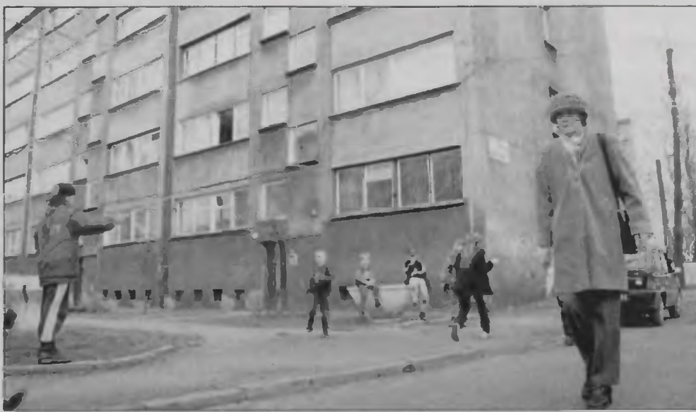
Na wykupienie mieszkania na dotychczasowych warunkach zdecydowało się 126 najemców hutniczych lokali.

Według pracowników urzędu byłe hutnicze mieszkania można kupować na takich samych zasadach, jakie obowiązują przy sprzedaży innych lokali komunalnych. By zachęcić świętochłowiczów do