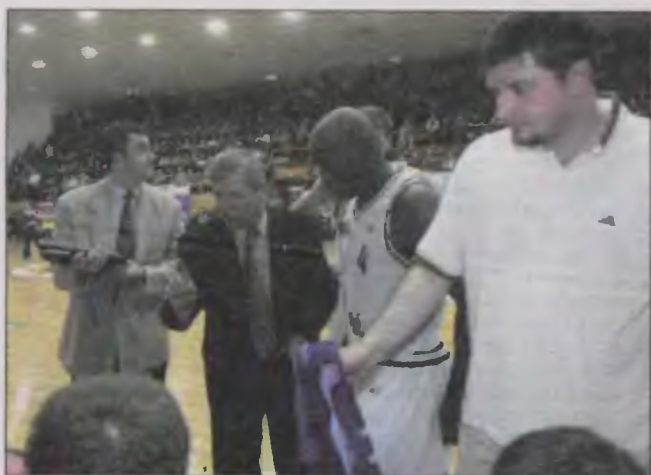
Kto wreszcie znalazł sposób na przełamanie Impasu.

Koszykarze przychodzą do hali i między sobą dyskutują, jakie ostatecznie będzie rozwiązanie tego problemu, działacze natomiast chyba zabrnęli w ślepy zaułek... ■ SOW