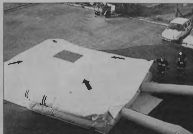
Skokochron używany był na razie tylko podczas ćwiczeń.

Skokochron to nie jedyny zakup dla PSP. W ostatnim czasie strażacy otrzymali także samochód terenowy Kia, nowe aparaty tlenowe oraz rzutki i 7-osobowy ponton do ratownictwa wodnego. Sponsorzy sfinansowali także tzw. plecakiowy aparat gaśniczy, który umożliwia ugaszenie pomieszczenia minimalną ilością wody. ■ PS