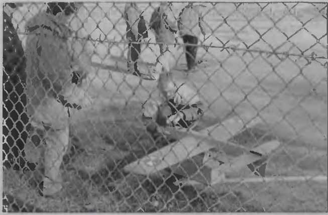
Sprzęt przed lotem musi przejść próbę sprawności na ziemi.

W gronie modelarzy pasjonujących się halonami na ogrzane powietrze rozegrano na kręgach modelarskich przy ul. Olsztyńskiej mistrzostwa Częstochowy. Modelarze samolotowi jedynie zaprezentowali możliwości skonstruowanych i zrobionych przez siebie makiet, bez rywalizacji o miejsca i punkty. Za to konkurowali ze sobą balonowcy.