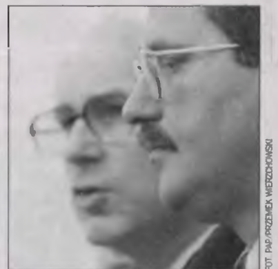
B. Komorowski z J.M. Rokitą.

mu, w którym znaczna część szkolenia odbywałaby się w czasie studiów. Według Rokity, należy „porzucić system wcielania młodych inteligentów w kilkumiesięczny rytm koszar”, zamiast tego szkoląc ich dwa razy przez miesiąc w odstępie roku, co zmniejszyłoby uciążliwość obowiązku wojskowego i ułatwiło absolwentom poszukiwanie pracy. ■ PAP