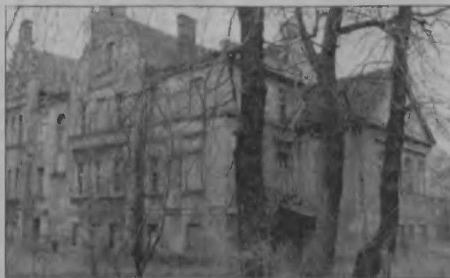
Baranowicki pałacyk był niegdyś chlubą miejscowości.

- Kupując zabytek, nabywcy wiedzą o tym, że ponoszą za niego odpowiedzialność - powiedział nam w Śląskim Wojewódzkim Oddziale Służby Ochrony Zabytków. ■ IZIS