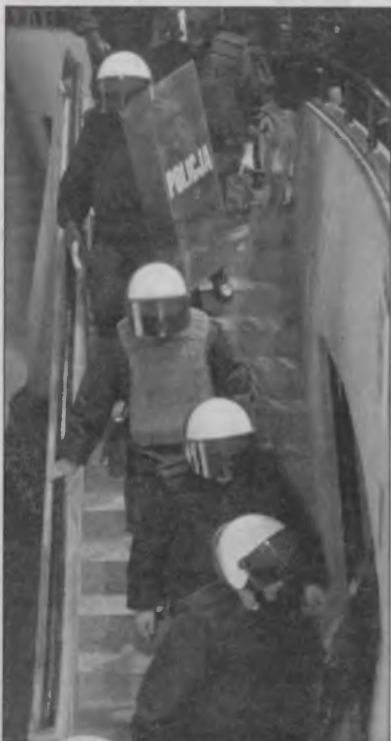
Teraz policjanci będą ochraniać imprezy masowe „po godzinach”?

W województwie śląskim funkcjonariuszy, którzy mają zezwolenie na dorabianie po godzinach jest niewielu. Większość naszych rozmówców twierdziła, że służbowe zajęcia tak dalece ich obciążają, iż trudno znaleźć czas na inne zajęcia. Na przykład żaden z pytanych przez nas rzeczników prasowych: w Katowicach, Częstochowie, Mysłkowicach i Kłobucku nie ma czasu na pisanie do branżowych pism czy gazet, choć to zajęcie nie wymaga zgody przełożonych i daje gratyfikację w postaci honorarium.