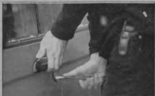
Najlepszym złodziejom wystarczy kilkanaście sekund na otwarcie cudzego samochodu.

kilka podobnych przestępstw. Samochodowych złodziei zatrzymano również w Czechowicach-Dziedzicach. Dwaj policjanci z czechowickiego komisariatu udaremniili kradzież samochodu fiat cinquecento, zaparkowanego przy ul. Jagiellońskiej. Do pomieszczeń dla osób zatrzymanych odprowadzono czterech mieszkańców powiatu bielskiego, mających od 16 do 29 lat. Policjanci ustalili, że złodzieje ci włamali się wcześniej do kilku innych samochodów na ul. Szarych Szeregów, jednak tamtych aut także nie udało się im ukradnąć. ■ WAG