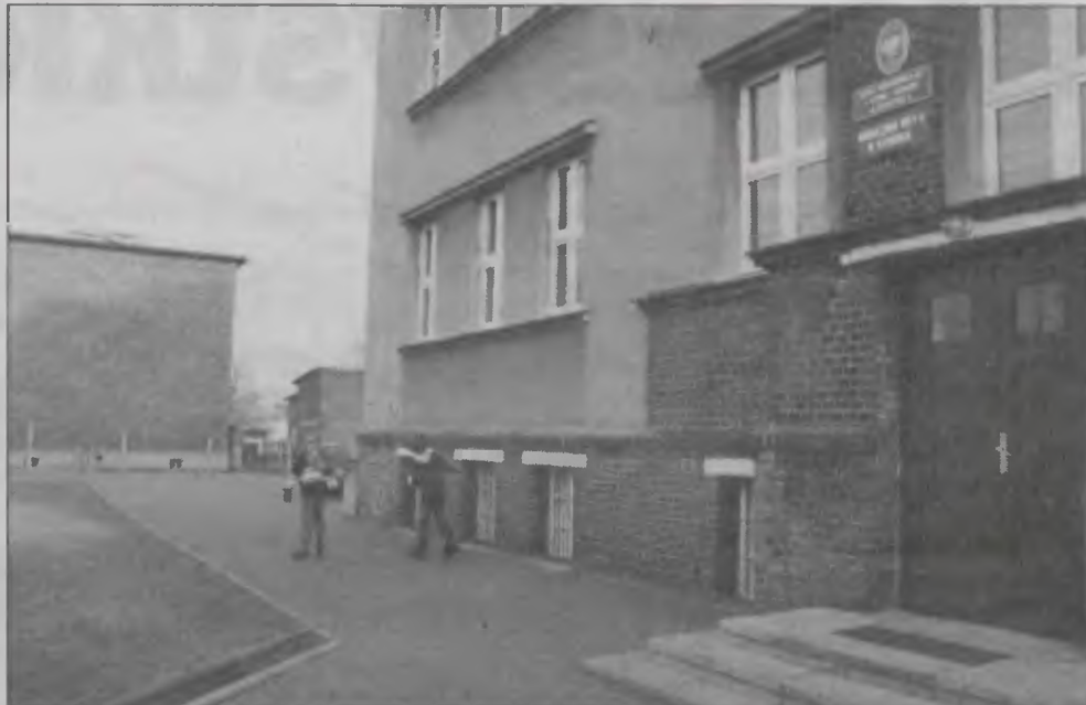
Nasze dzieci lubią tą szkołę i nie chcą się przenosić - argumentują rodzice.

- Przecież on się urodził w Kamieniu, tutaj mieszka, więc czemu nas nie poprze? - pytają rodzice. - My chcemy coś zrobić, a on jako