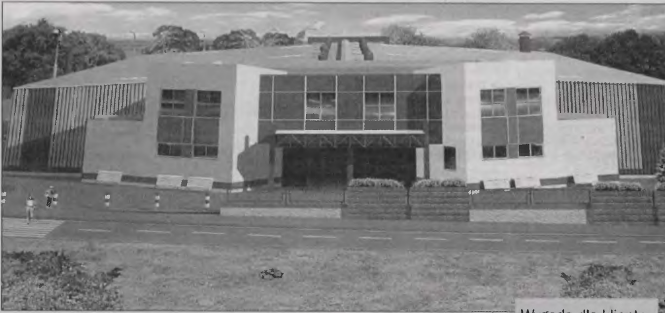
Projekt nowej hali targowej wygląda imponująco.

Jaworzniccy kupcy zapłacą 5 mln zł, by przy ulicy Mostowej w centrum miasta powstała nowoczesna hala targowa. Przedsięwzięcie zjednoczyło w działaniu wszystkie związki kupieckie. Rozpoczęła się już budowa pawilonu, w którym pracę znajdzie 70 osób.