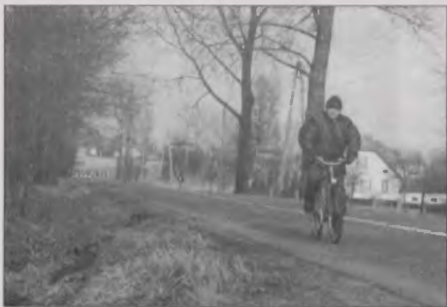
Wąskim poboczem tej ruchliwej drogi do szkoły chodzą m.in. dzieci.

POŁOMIA: Będzie chodnik przy ul. Wolności