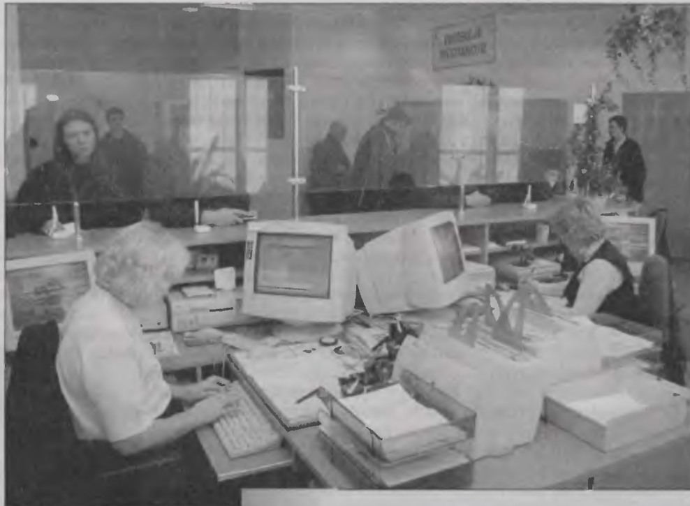
Na wydawanie nowych dowodów nie pozwala system komputerowy.

– Wbrew zapewnieniom Ministerstwa Spraw Wewnętrznych