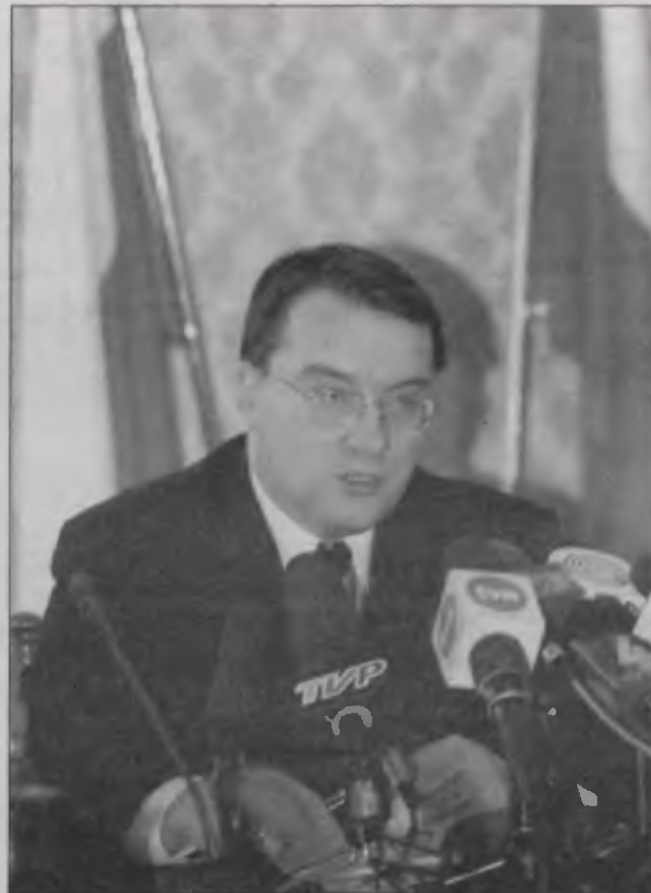
Minister Marek Biernacki podczas konferencji prasowej.

– Chodzi o narzucenie ścisłego rygoru w egzekwowaniu powinności. Program zmusza do