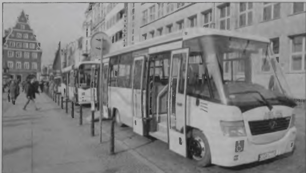
Zakłady Samochodowe „Jelcz” na placu Solnym we Wrocławiu zaprezentowały swoją najnowszą ofertę w postaci autobusów dla komunikacji miejskiej.

B. komendant wojewódzkiej policji skazany za pomówienie senator Anny Boguckiej-Skowrońskiej o współpracę z SB