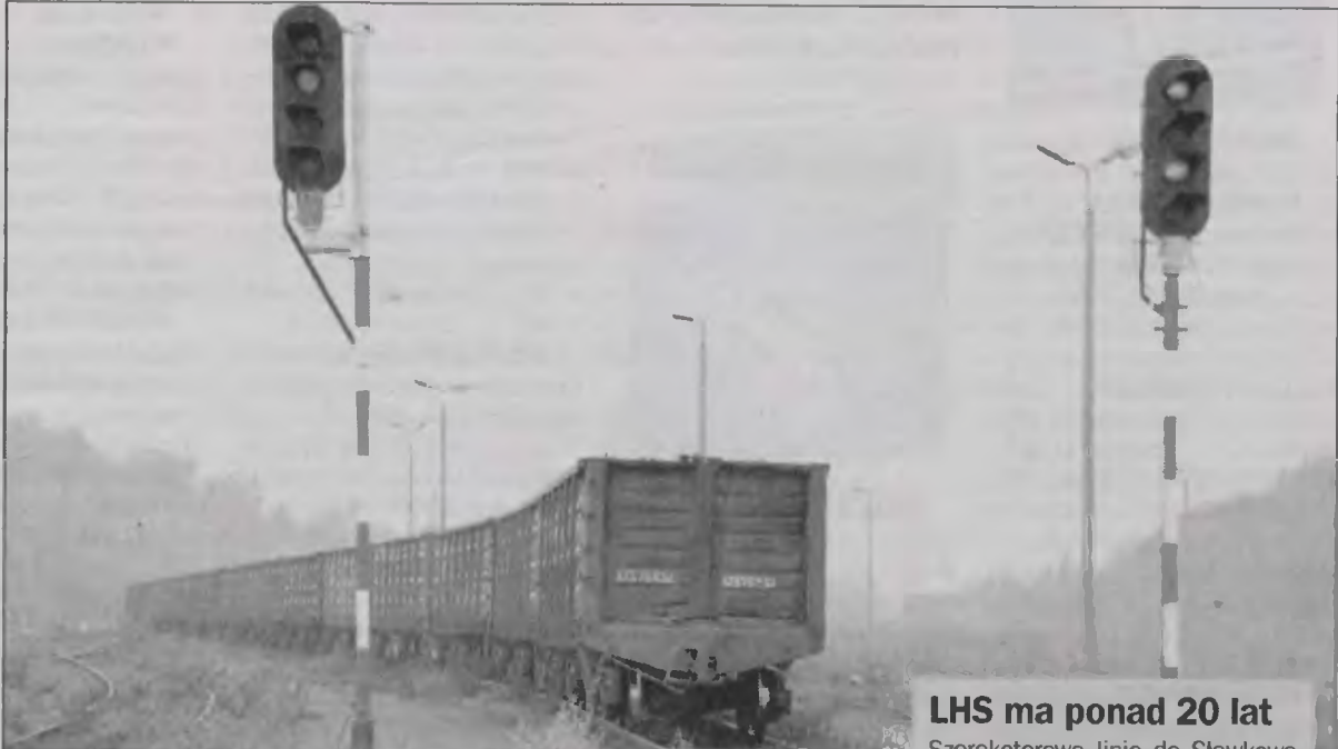
Zainteresowanie terminalem przeładunkowym w Sławkowie deklarują różni inwestorzy.