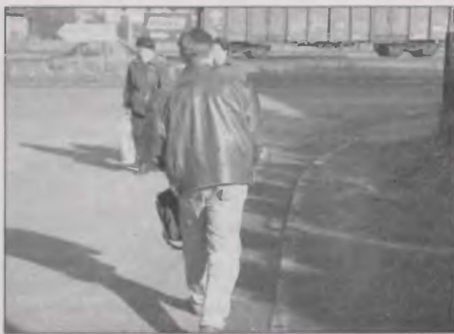
Ulica B. Prusa w Lodygowicach pilnie czeka na chodnik.

Przekazanie dochodzenia kieleckim prokuratorom świadczy o połączeniu wątków różnych spraw. Okazało się bowiem, że przykłady podobnego przemytu aut wykryto w kilku innych miejscach polskiej granicy. ■ ORKA