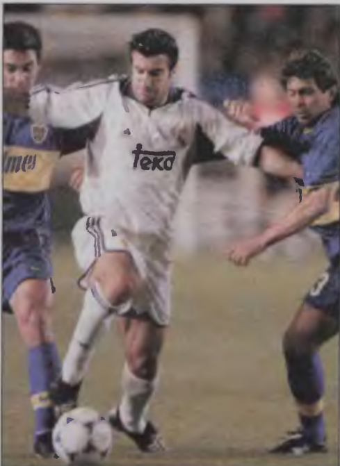
Luis Figo z Realu Madryt (w środku zdjęcia z lewej strony) w pierwszym tegorocznym występie w Lidze Mistrzów stanie oko w oko z gwiazdą Lazio Hernanem Crespo.

Początek wszystkich meczów o godz. 20.45.