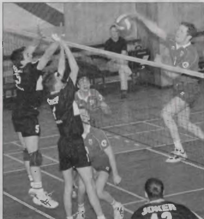
Zespół Jokera wywalczył awans.

Mężczyźni. Grupa zachodnia: MKS Andrychów – AZS Politechnika Śląska Gliwice 2:3 (19:25, 22:25, 25:19, 25:20, 10:15) i 3:0 (25:22, 25:21, 25:22) – stan rywalizacji 1:1. Astra Ustronie Morskie – MCKiS Górnik Jaworzno 1:3 (25:15, 24:26, 26:28, 15:25) i 3:0 (25:20, 25:18, 25:9) – stan rywalizacji 1:1. Beckers Jokre Piła – Ixi-Oil Wieluń AZS Częstochowa 3:1 (25:19,