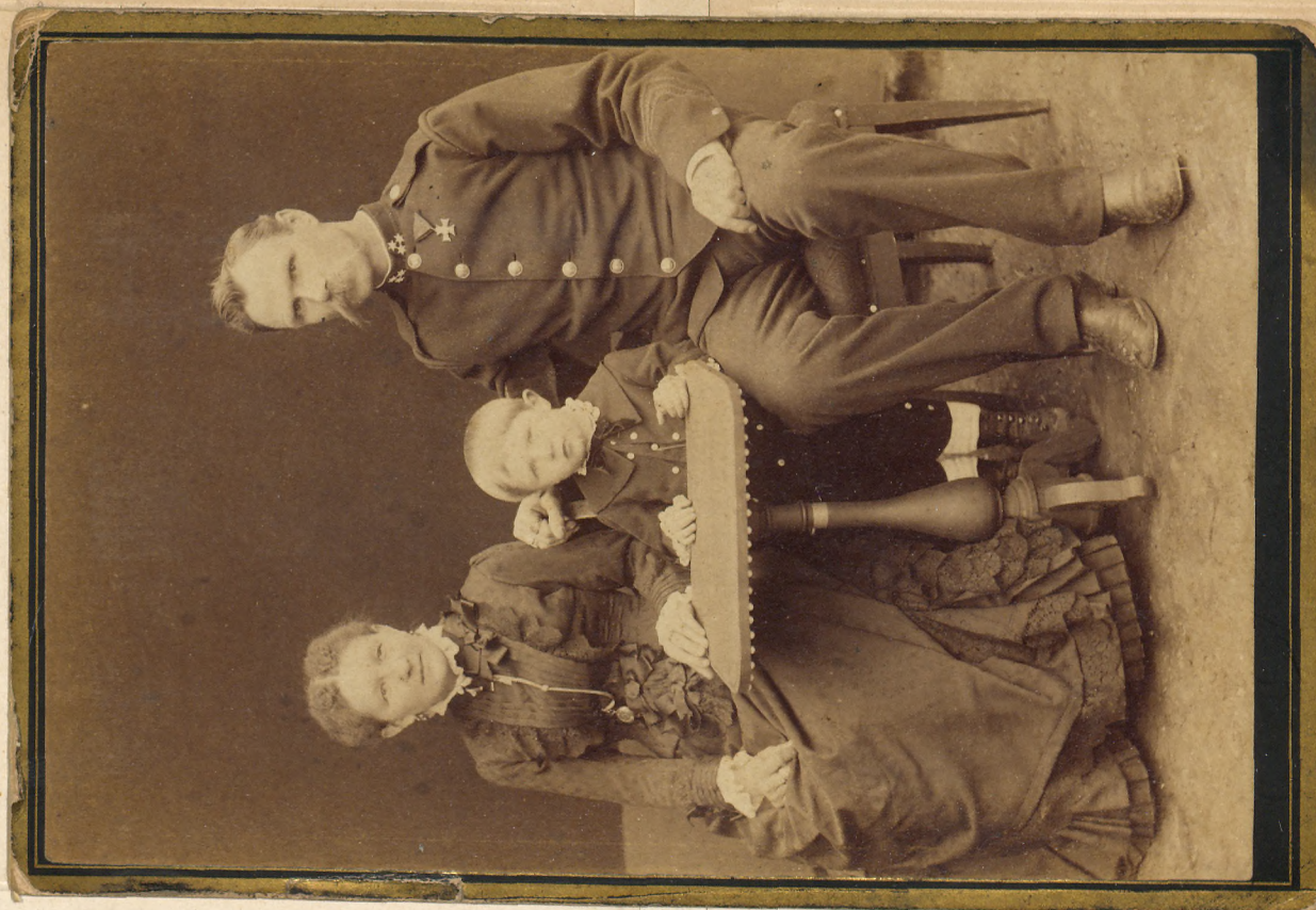
Prvního W. A. T. v. Krasné Straně a j. m. z. Jan 1871