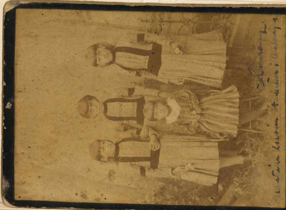
W. A. T. in Krasna Strana i W. A. T. i -Krasna-