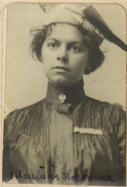
Maniła w Hosiowa