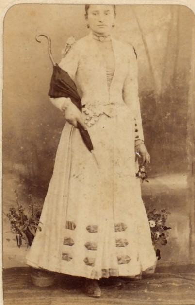
GNER MÁRTON fényképész BUDAPEST