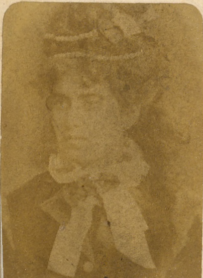
Maria Skłodowska