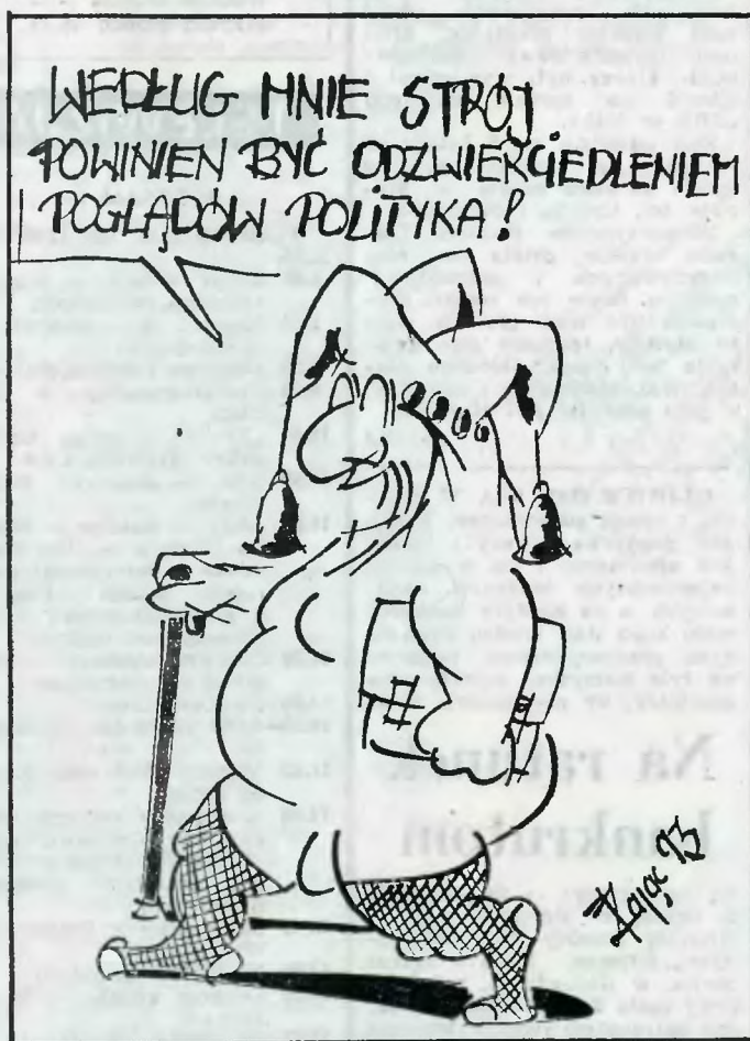
Rys. J. Zając