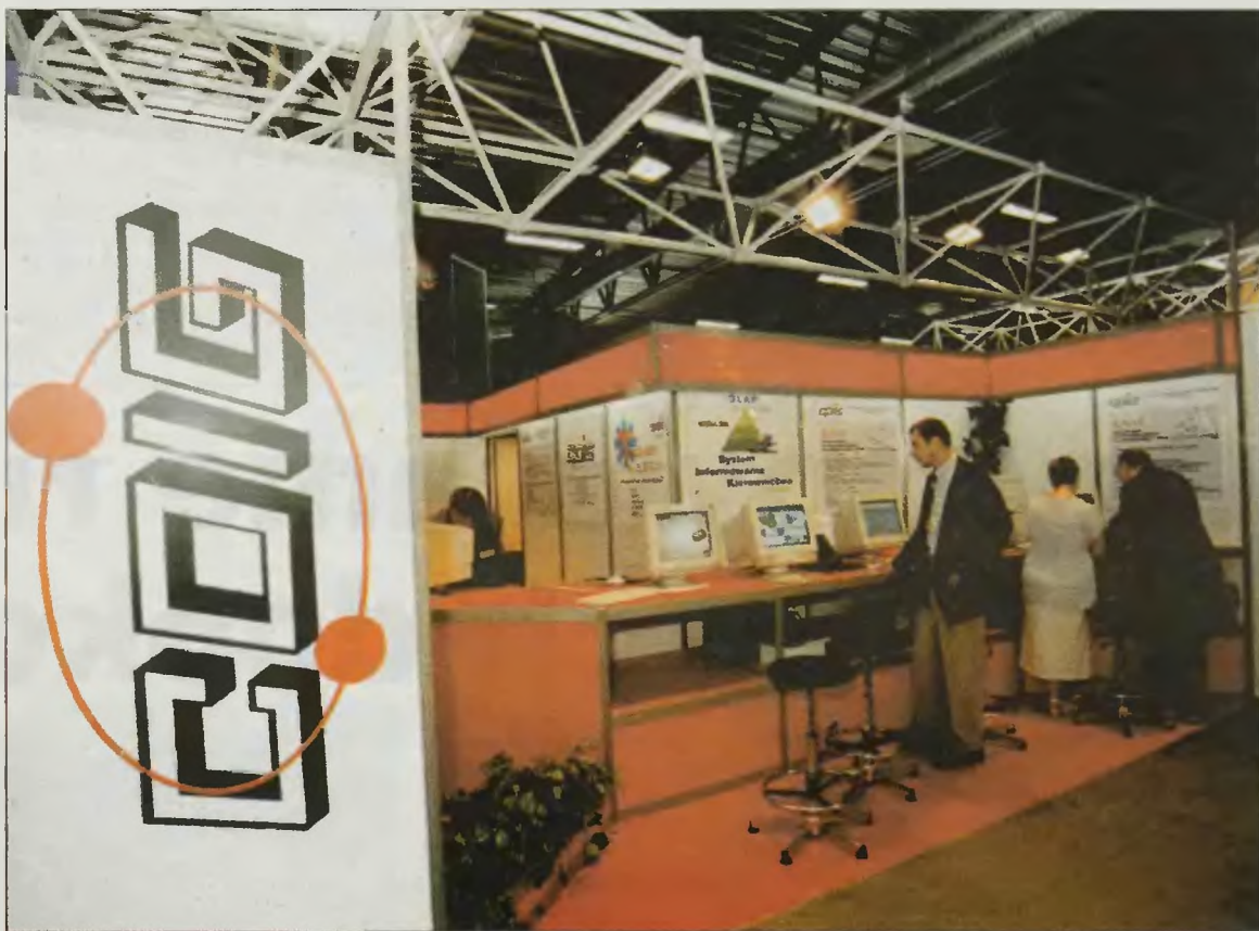
Katowicka ekspozycja COIG SA ma też wabić nową klientelę spółki.

Katowicka ekspozycja COIG SA ma też wabić nową klientelę spółki. W tym jej fragmencie znajdują się propozycje dla gmin oraz szpitali. Informatycy ośrodka, obok rutynowych działań ewidencyjnych, gotowi są zatem ułatwić magistrackim urzędnikom kontrolę gminnych budżetów i procedur podatkowych. W propozycji dla szpitali jest system rejestrowania pacjentów, mogący zawierać m.in. historię choroby, wyniki badań, jakim zostali poddani, oraz rodzaj zalecanej przedtem kuracji. (jch)