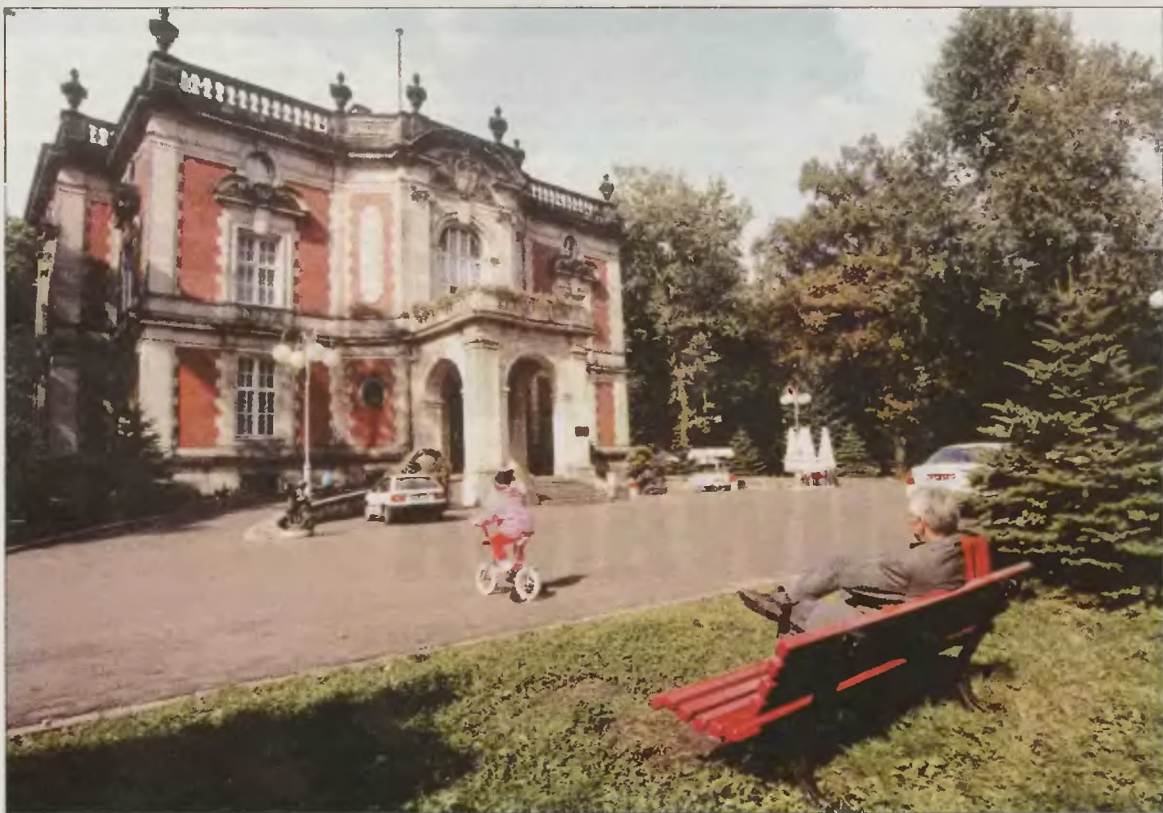
Pałac Kawalerów zarabia na utrzymanie całej posiadłości.