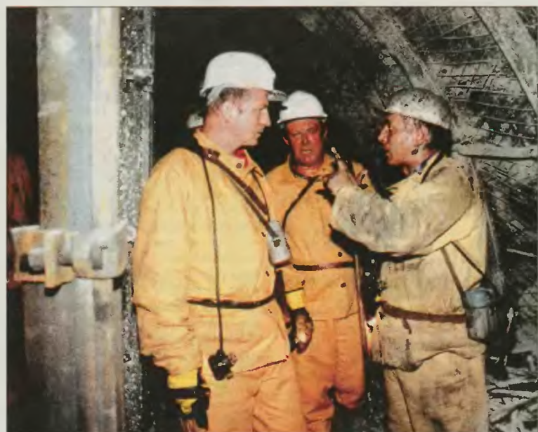
Marszałek Sejmu Maciej Płażyński (pierwszy z lewej) podczas pobytu w kopalni „Halemba”.