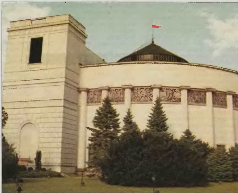
Sale sejmowe były przez kilka ostatnich dni miejscem ważnych dla górnictwa rozmów.