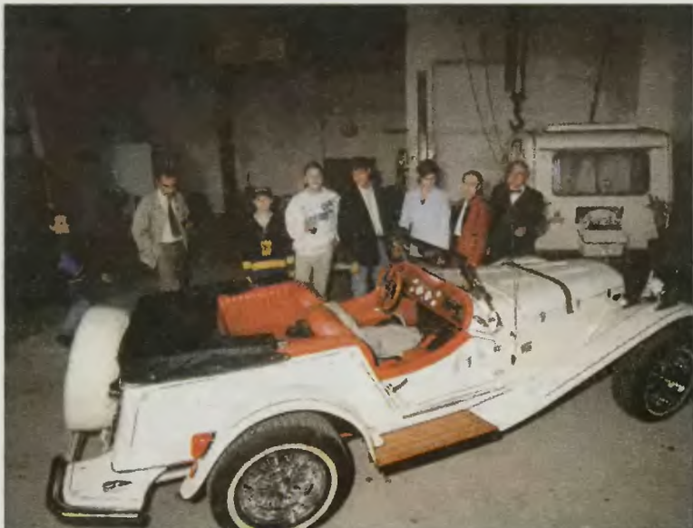
W ciągu roku w Zabrzu powstało Muzeum Pojazdów Zabytkowych. Stałą ekspozycję posiadała dotychczas jedynie Warszawa i Poznań.

Kilka lat temu na terenie nieczynnej części ówczesnej kopalni „Zabrze” utworzono skansen górniczy „Królowa Luiza”. Obecny odwrót od przemysłu ciężkiego, dokonujący się w całej Europie, odsłania i wystawia na widok publiczny opuszczone hale, wieże, maszyny, całe podporządkowane dawnej produkcji kompleksy górnicze. Można je zburzyć i tak się czyni, jeśli nie przedstawiają zabytkowej wartości. Innym rozwiązaniem jest rewitalizacja, czyli ożywienie i przywrócenie funkcji użytkowych przemysłowym zabudowaniom, z zastosowaniem rewolucyjnych zmian w zakresie funkcji.