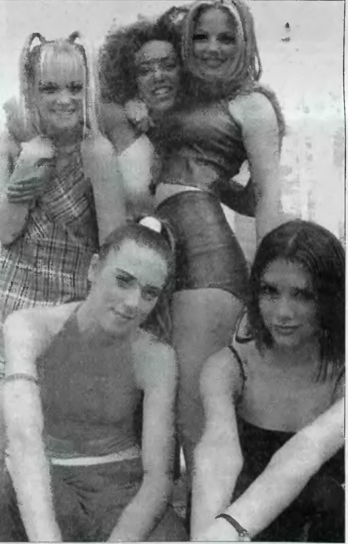
Spice Girls to dziewczyny z charakterem.