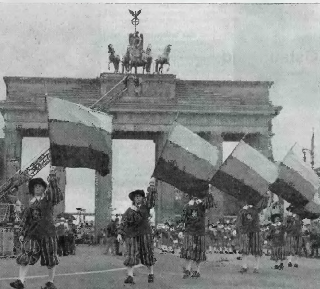
Uroczystości pod Bramą Brandenburską w Berlinie.

George Bush sięgnął głębiej. To on wskazał, że jedność Niemiec bierze początek również z „Solidarności”, Lecha Wałęsy, a także aksamińskiej rewolucji w Pradze. Zarówno Kohl, jak i Bush akcentowali wkład obywateli NRD,