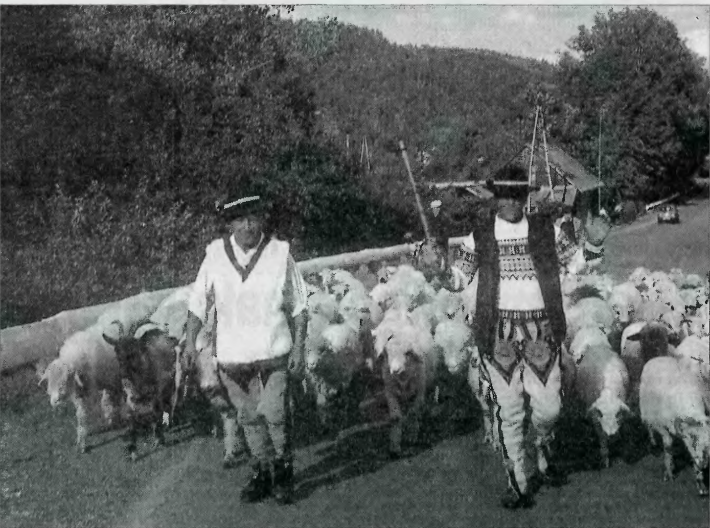
Beskidzcy górale wrócili już do domu ze swymi stadami. W ostatnich latach owieczek robi się, niestety, coraz mniej, ale tradycja jesiennego redyku trzyma się dobrze. Pewnie ze względu na atrakcyjność... turystyczną.