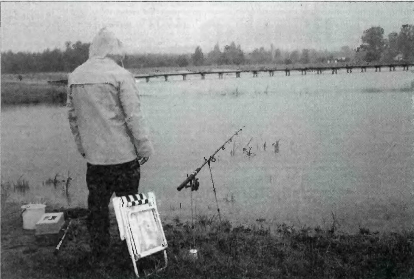
Ludek wędkarski pod każdą szerokością wydaje się być odporny na kaprysy aury.