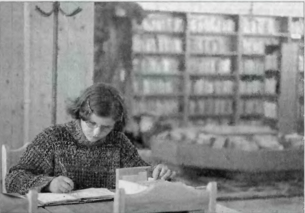
Biblioteka dzięki przeprowadzce zyskała nowych czytelników.

W dawnym sklepie „Mody Polskiej” otwarto bibliotekę. Jest ona najnowocześniejszą placówką tego typu w Tychach.