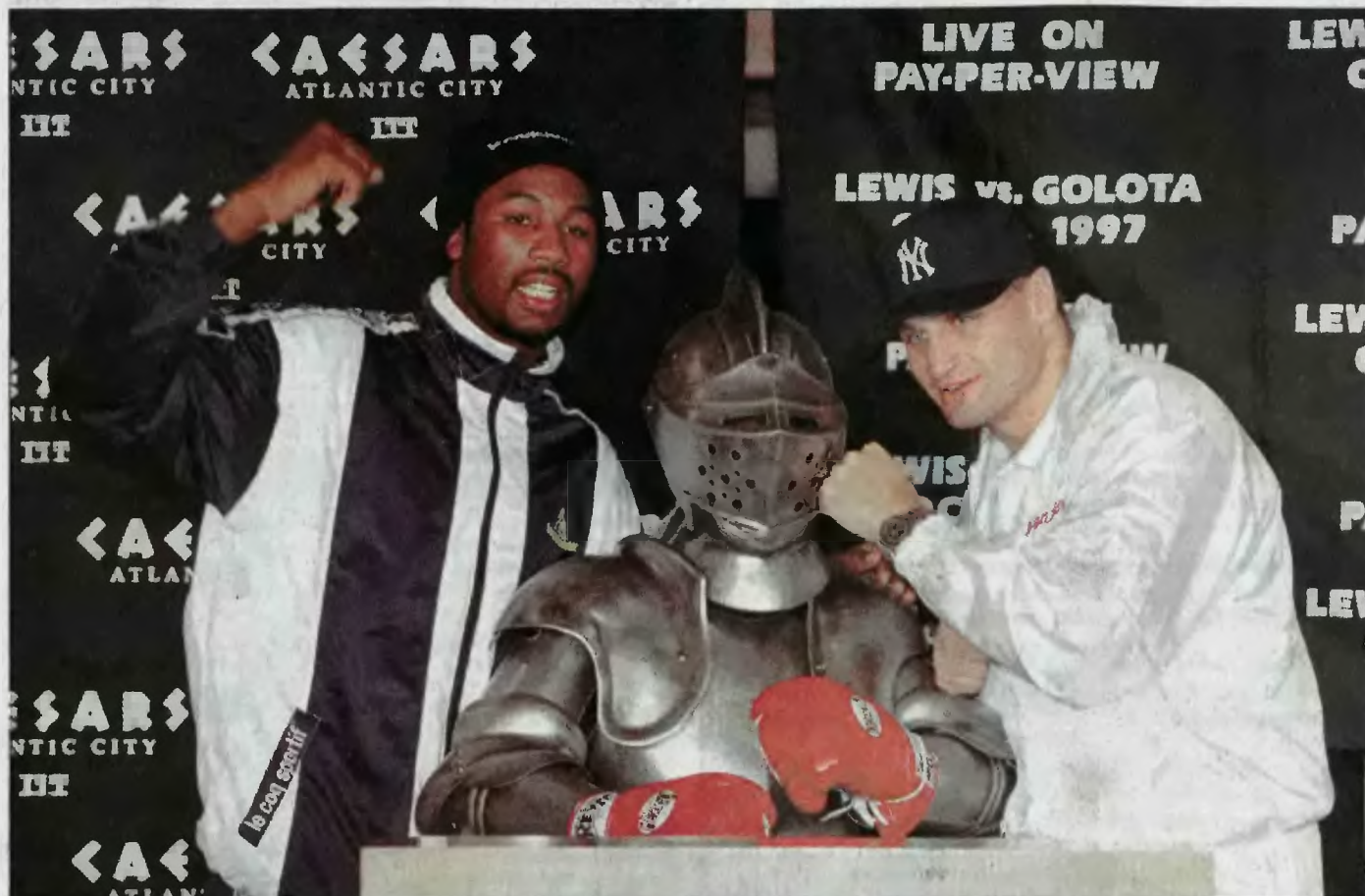
Dziś w nocy w Atlantic City Andrzej Golota (z prawej) stoczy pojedynek z Brytyjczykiem Lennoxem Lewisem - pięściarskim mistrzem świata wagi ciężkiej organizacji WBC. Czy tym razem nie stałuje? SPORT STR. 8