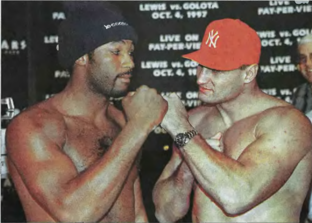
Wojna nerwów między bokserami toczyć się będzie o pierwszego gongu.