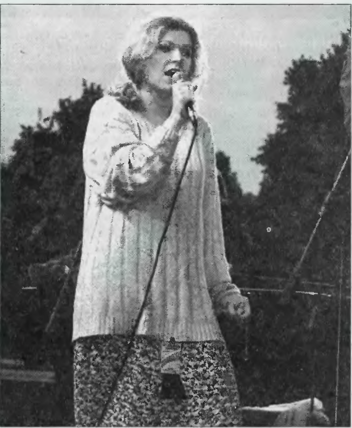
Niewątpliwie pomógł jej festiwal w Dublinie, dalsza droga zależy od piosenki.