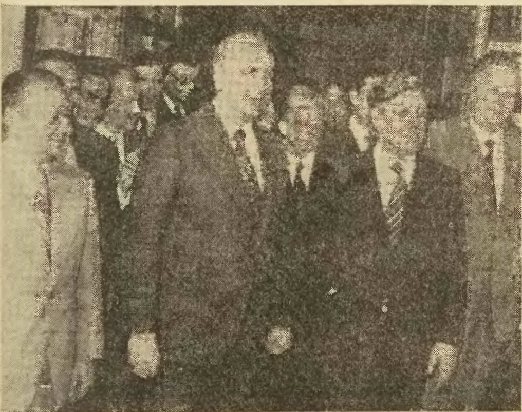
Tow. Edward Gierek i Helmut Schmidt w czasie spotkania w Bonn.