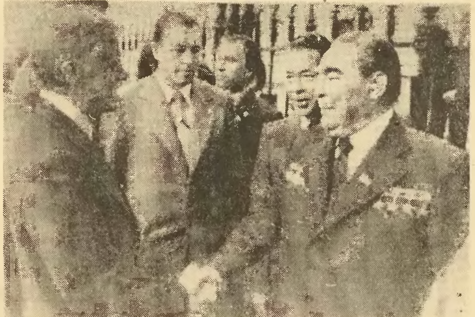
Na zdjęciu: spotkanie Leonida Breżniewa i Jimmy Cartera.