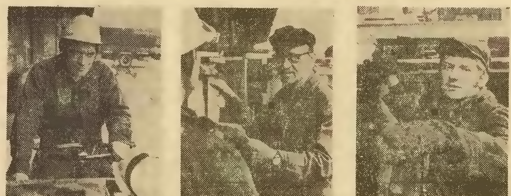
Mówią produjący pracownicy ekspedycji rejonowej PSK w Katowicach - Zaleźni: