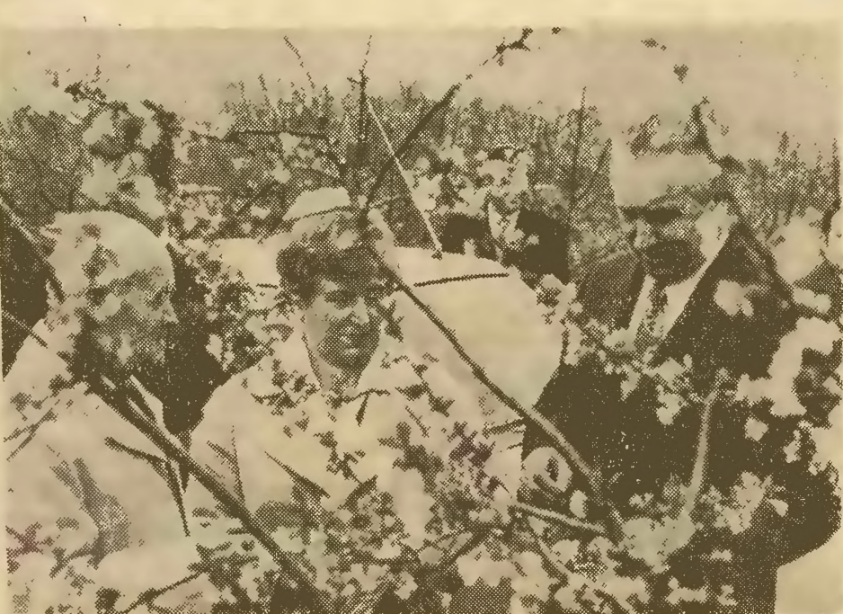
Tow. Edward Gierek wraz z małżonką zwiedził Instytut Sadownictwa w Skierniewicach.