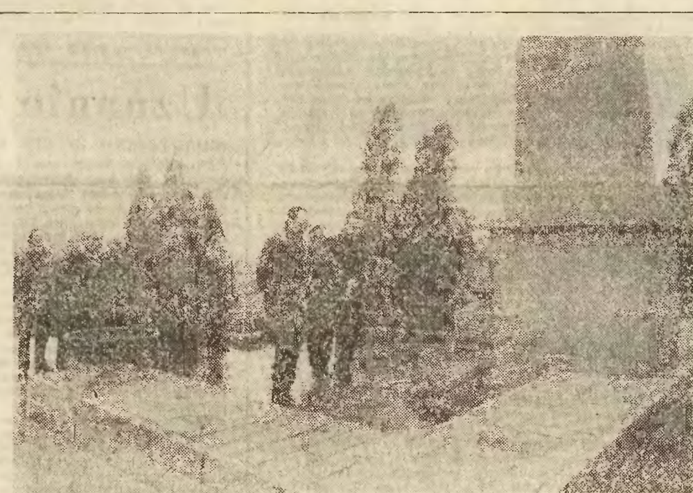
Podczas składania kwiatów pod obeliskiem na Cmentarzu Żołnierzy Radzieckich w Katowicach.

Rolnicy woj. katowickiego startują do tej wiosny bez zaległości. Jesienią obiano zgodzie z planem 70 tys. ha, a wiosną pod zboża iare nówide 58,5 tys. ha — w tym 7 tys. ha orsznic, 22 tys. ha jęczmienia, 20,5 tys. ha owsa i 8 tys. ha kukurydzy. Nawozy — Nawozy jest pod dostatkiem, do punktów GS-owskich sprowadzono już 2,5 tys. a sprzedano 2,053 ton. Nie brakuje w tym roku po raz pierwszy zreszta od lat, nasion i motylkow, ba są nawet zaliczani Rolnicy kruszyna mała, która siewu — chłonie widać iż de- zycja o dotowaniu zrobiła swoje. Podobnie zadziałają sezonowe bonifikaty przy sprzedaży nawo-