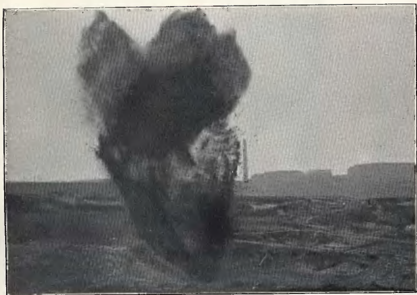
Wysadzenie bieda-szybu w powietrze