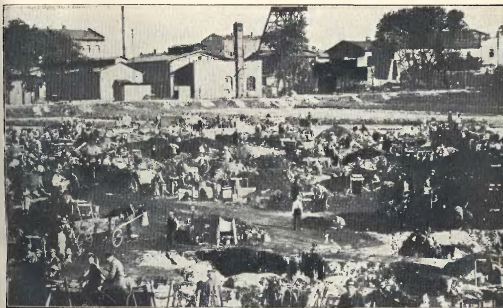
Bieda-szyby w Welnowcu pod Katowicami