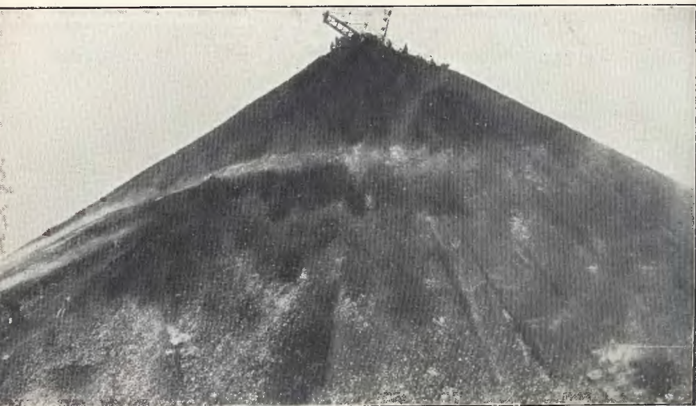
Zbieranie węgla na hałdzie kopalni Hoym (pow. rybnicki)