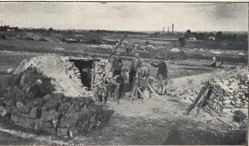
Bieda-szyb z wentylatorem i schronem dla ludzi.