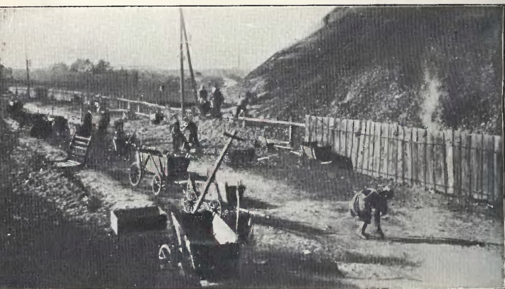
Zbieranie węgla na hałdzie kopalni Hoym (powiat rybnicki)