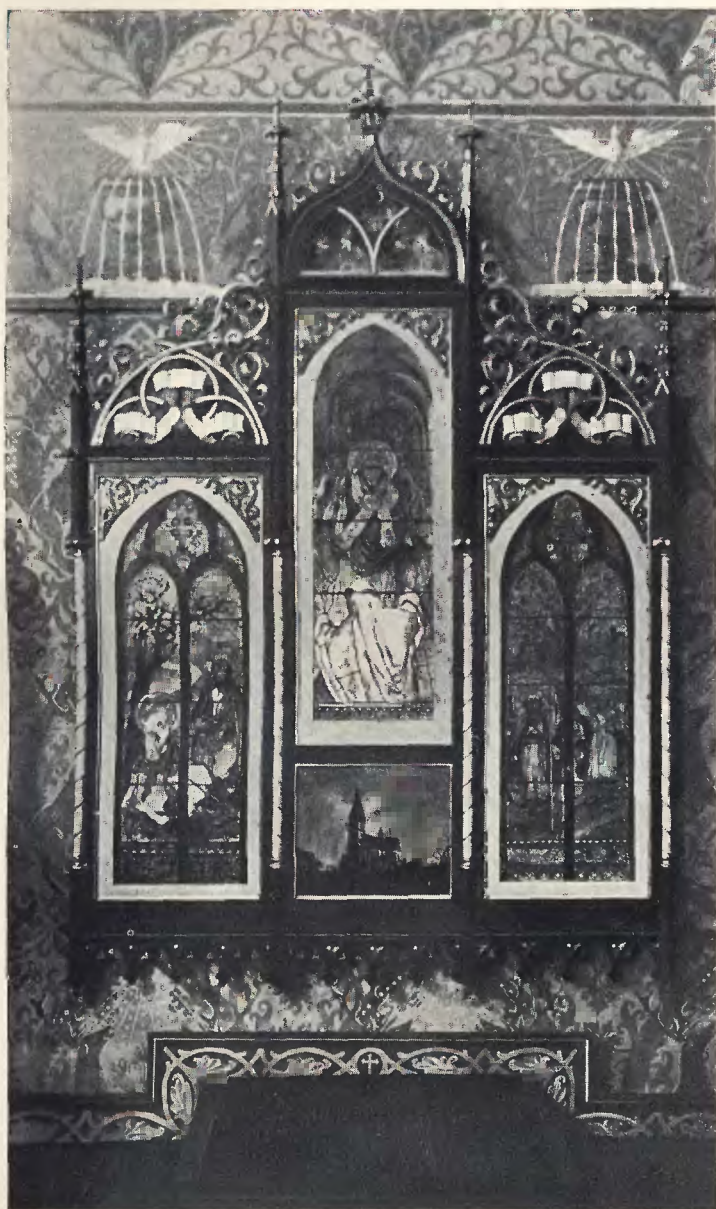
Kartony Włodzimierza Tetmajera w Ligocie (pow. prudnicki)