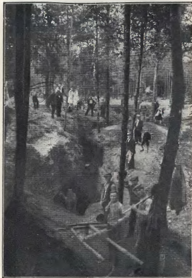
Chodnik (kolonia Agaty)