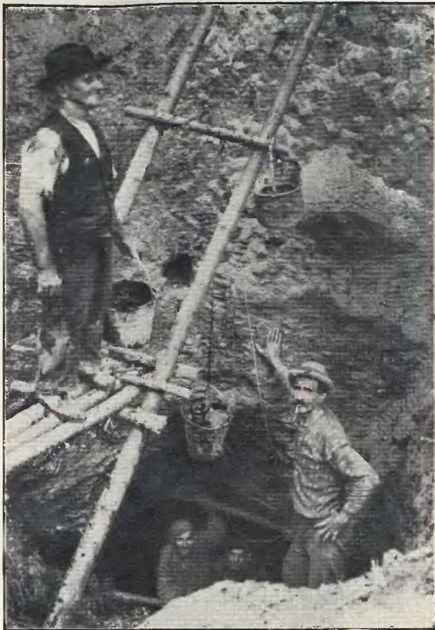
Wnętrze bieda-szybu (kolonia Agaty)