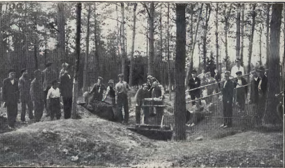
Bieda-szyb w Kolonii Agaty pod Mysłowicami