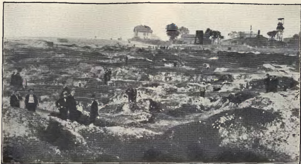
Bieda-szyby w Wełnowcu po likwidacji